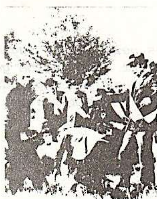
- et les cambrioles