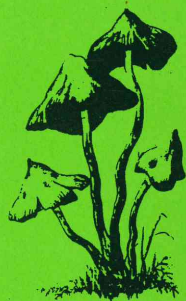
Psilocybe zapotecorum (Richard Evans Schultes)

Bulletin de l'A.E.M.B.A. - N° 28 - Novembre 1994.