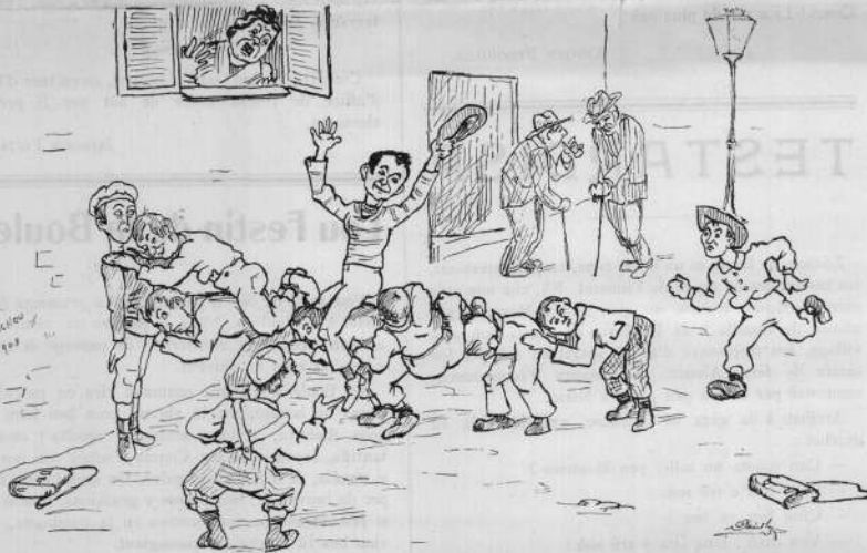
En plassa Rossetti - La partida de Seba-ayet païrou

Li era lou tem daï billa, daï sourda, daï gavoudoula, daï aglan, che s'anavou serca en Casteù per garni lu sambloc, daï fabrecola, emb'un canou de cana, doun si tirava lu meriou su li gaùta ! D'aùtre, lou giou, anavou au rouil, au bort de mar, serca de cuivre et d'aran che vendiou à Chichirlou, lou marcian de berlingot, per caùchi caramela russa... Si crompava de bataille de sourda (douù per un sou), che si coulavou soubre de cartoun, pi, coupat