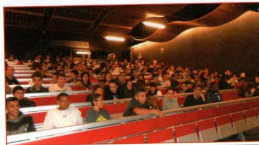
Mardi 19 novembre à 14h : 176 élèves des collèges MISTRAL, VERNIER et GIONO visionnent Ike opération Overlord dans la salle Laure ECARD

Au total, ce sont 79 classes de 3 e , 1 e et terminale qui ont été sensibilisées contre 85 l'an dernier et 136 en 2017 et 2 104 spectateurs qui ont bénéficié de ces projections contre 2 469 l'an dernier. En effet, les collèges Jean-Henri FABRE, L'Archet, SASSERNO, SÉGURANE ainsi que les lycées APOLLINAIRE, D'ESTIENNE d'ORVES et MASSENA n'ont pas répondu favorablement à nos sollicitations, malgré les rappels effectués. En revanche, nous avons constaté avec satisfaction le retour du collège VERNIER (2 classes et 54 spectateurs).