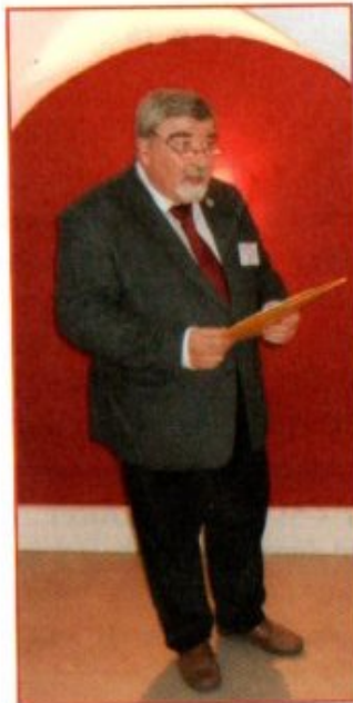
L'allocation du président