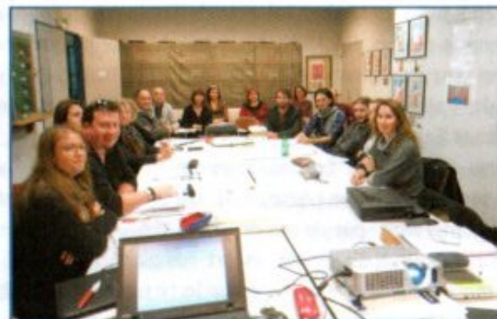
Une vue partielle de l'assistance