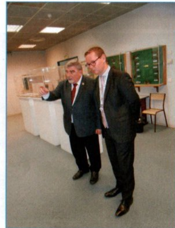
Le sous-préfet écoutant les commentaires du président du MRA dans la salle de l'exposition temporaire

Il a écrit sur le livre d'or « Un vrai bonheur et un véritable honneur que de visiter dans Nice le Musée de la Résistance Azurienne théâtre d'une histoire douloureuse dans ce qu'elle rappelle et si nécessaire dans ce qu'elle évoque, à savoir les valeurs de la République, trop souvent remises en cause mais qui finissent inéluctablement par vaincre ».