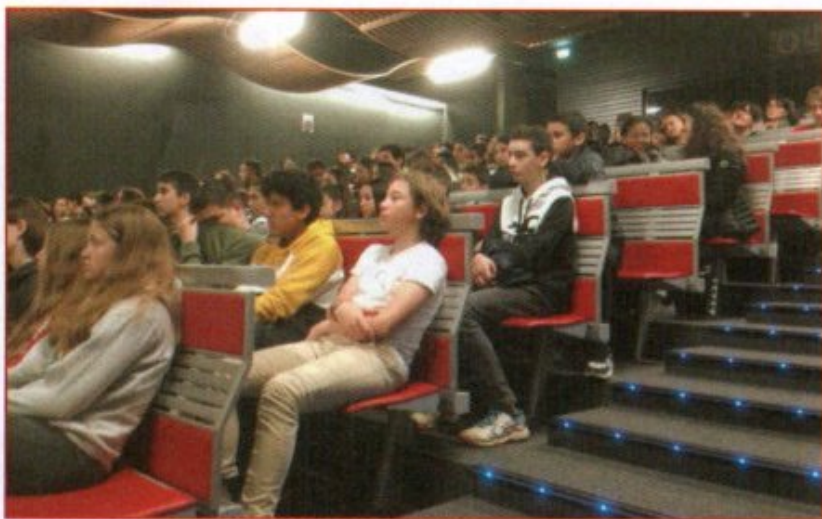
Mardi 19 novembre à 9 h : 216 élèves des collèges RISSO, MATISSE, MISTRAL et du lycée PASTEUR visionnent Monsieur Batignole dans la salle Laure ECARD

Les films qui ont eu le plus de succès ont été : Ike opération Overlord (430), Le vieil homme et l'enfant (258), Monsieur Batignole (218), To be or not to be (202), La vie sera belle (198), La bataille du rail (196), Casablanca (192), Un homme de trop (156), L'appel du 18 juin 1940, ce jour-là tout a changé (126), La petite prairie aux bouleaux (105).