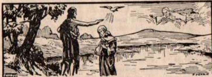
La Trinité se manifeste au Baptême de Jésus