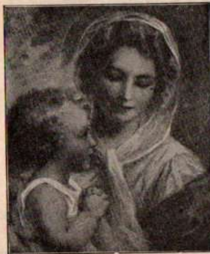
Madone, d'après Ed. Cabane

Et sur sa tombe que recouvrira dans quelques mois la neige des Alpes, soupirez en pensant aux jeunes filles perdues par ce mirage, ces immoraux Concours de Beauté dont les conséquences sont si souvent des fruits de mort.