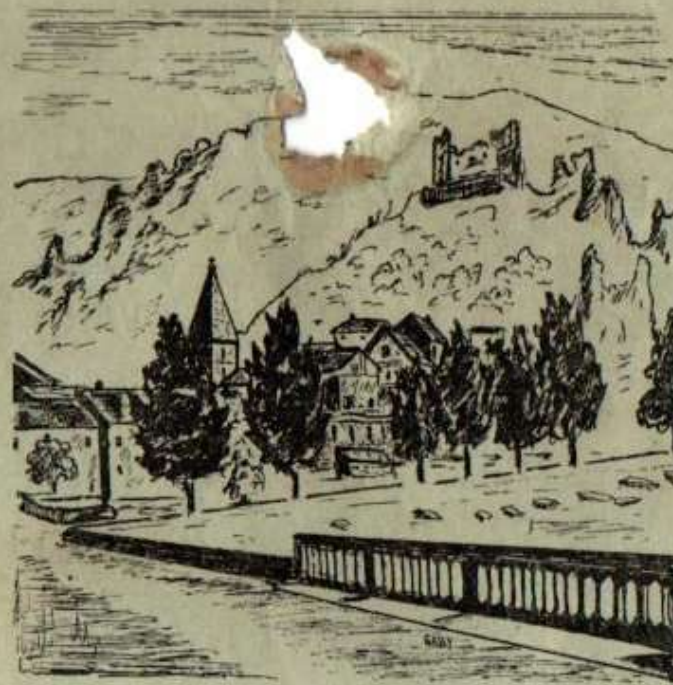
L'entrée de Guillaumes

Bulletin Paroissial de St. Martin d'Entraunes (Alpes-Maritimes)