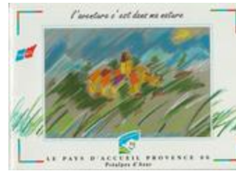
Le pays d'accueil provence 06. Préalpes d'Azur (BIB-0017146)