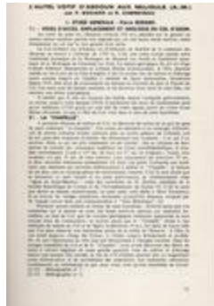
L'autel votif d'Abdoun aux Mujouls (A.M.) (ART-18003278)

Images de montagne. Villages, églises et chapelles des communes des Monts d'Azur (BIB-0011552)